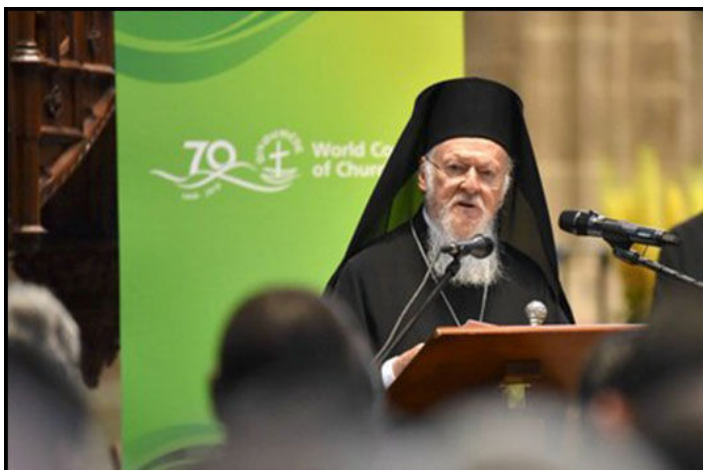
17-6-2018. Έορτασμοί για τὰ 70 χρόνια από τήν ίδρυση τοῦ «Παγκοσμίου Συμβουλίου τῶν Ἐκκλησιῶν (Π.Σ.Ε.)». Στήν ὁμιλία του ὁ Πατριάρχης Βαρθολομαῖος ἐπαίνεσε τό Π.Σ.Ε. καί καυχήθηκε ὅτι τό Οἰκουμενικό Πατριαρχεῖο εἶναι ἓνα ἀπό τὰ ἰδρυτικά του μέλη!