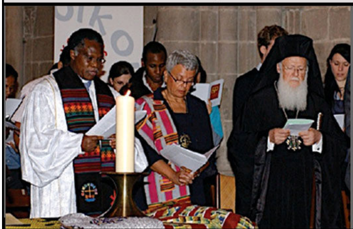
2008. Ὁ Πατριάρχης μετέβη στή Γενεύη, στήν ἔδρα τοῦ Π.Σ.Ε., γιά τόν ἑορτασμό τῶν 60 χρόνων του καί συμπροσευχήθηκε μέ ἄνδρες καί γυναῖκες πάστορες!

Εἶναι πολύ ενδιαφέρον, στην ιδιόχειρη ἐπιστολή του Ἁγίου που θα διαβάζουμε στη συνέχεια, το ὅτι ο π. Παῖσιος επιχειρηματολογεῖ με πολύ ωραῖο τρόπο για να αποδείξει στον Μάιπα ὅτι εἶναι απαραίτητη ἡ νηστεία πριν ἀπό τή Θεία Κοινωνία! Παρατηροῦμε κι ἐδῶ ὅτι αποκαλεῖ τον π. Αυγουστῖνο «Πατέρα» με κεφαλαῖο πι! Ἐπίσης, ἐντύπωση προκαλοῦν καί σ' αὐτήν τήν ἐπιστολή τα σοβαρότατα ὀρθογραφικά καί γραμματικά λάθη που κάνει ο ἅγιος μοναχός. Παραδείγματος χάριν, τή λέξη «Ἁγιορεῖται» τήν γράφει: «Ἀγιωρίτε»! Αὐτό προκαλεῖ ἐκπληξη γιατί ἐνῶ ἦταν θεοφόρος καί εἶχε ὅλα τα Χαρίσματα του Ἁγίου Πνεύματος, ο Θεός δεν τόν φώτιζε να γράφει ὀρθογραφημένα! Ἐδῶ, κατὰ τή γνώμη μας, ἔχει ἐφαρμογή ὁ λόγος του Κυρίου στον Παῦλο: «Ἀρκεῖ σοι ἡ χάρις μου ἢ γὰρ δύναμις μου ἐν ἀσθενείᾳ τελειοῦται» (Β' Κορ. 12:9).