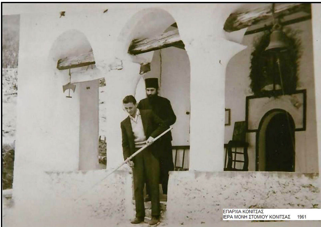
Ὁ Ἅγιος Παῖσιος τό ἔτος 1961 στήν Ἱερά Μονή Στομίου τῆς Κόνιτσας.

Ὁ ἐν Χριστῷ ἀδελφός σας Παῖσιος, ὁ ἐν Μοναχοῖς ἐλάχιστος, Ἀμαρτωλός.