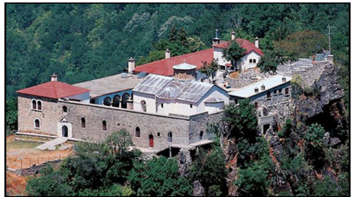
Η Ι. Μονή τής Παναγίας στό Στομιο τής Κόνιτσας ανακαινίστηκε τό 1959 από τόν Ἅγιο Παΐσιο τόν αγιορείτη.

κάποια ημέρα που επισκέφθηκε το Άγιο Όρος τον μάλωσε πολύ άσχημα ο Άγιος! «Ποιός σου έδωσε το δικαίωμα να δημοσιεύεις τα λόγια που λέω στους προσκυνητές και να με διαφημίζεις;» τον ρώτησε αυστηρά. «Έφυγα περίλυπος από την καλύβα του» διηγείται ο π. Διονύσιος και συνεχίζει: «Περπάτησα σκυθρωπός και έφτασα στο κελλί ενός γειτονικού ασκητή. Εκείνος μόλις με είδε με ρώτησε ανήσυχος: “Τι έχεις, πάτερ, και είσαι έτσι;” Του είπα τι ακριβώς συνέβη και τότε... άρχισε να γελάει! Μου είπε: “Ο π. Παΐσιος καλά έκανε και σε μάλωσε, αλλά κι εσύ πολύ καλά έκανες και τα δημοσίευσες!”» .