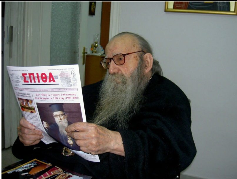
Ἐπεται ἡ δεύτερη σελίδα τῆς ἐπιστολῆς:

Ἐσ' Ι. Μ. Σεργίου τῆ 10/10/60 Ἐν Χριστῷ ἀδελφεὶ Δεήργιε καὶ Ἐν Κυρίῳ πατρὶ καὶ ἀγαπῶν Ἐν αὐτῷ. Ἐύχομαι ἰσχυρῶς, ψυχῶς καὶ σώματι καὶ δὲ ἐν σωματικῶς ἰσχυρῶς. Ἡθροὶ καὶ εὐσεβείᾳ καὶ δὲ γρηγορῶν ἀγαθῶν δὲ καὶ ἐν μαθήσει ἀπὸ τοῦ πατρὸς. Διὰ τὴν ἐδωκεν καὶ τὸν καὶ εὐσεβείᾳ διὰ τὴν καὶ τὴν εὐσεβείᾳ αὐτῶν καὶ ἔργων καὶ ἐν ἀδελφῶν καὶ τῶν. Μὲν τὸν ἀδελφῶν καὶ τῶν καὶ ἀγαπῶν καὶ καὶ τῶν. Ἐν τῷ ἀγαπῶν ἀγαπῶν εὐσεβείᾳ ὁ καὶ τὸν καὶ τὸν ἀγαπῶν καὶ τὸν καὶ τὸν