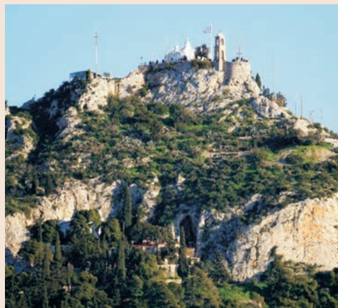
Αποψη προς το λόφο του Λυκαβηττού (1890 και σήμερα).

της Χριστιανικής ιστορίας του όλου Λυκαβηττού αναφέρομεν, ότι, εις την ΒΔ πλευράν τούτου υπό ικανώς ευρύ σπήλαιον εύρηται έτερος Χριστιανικός ναός του αγίου Ισιδώρου. Ολίγω δε τούτου κατωτέρω υπό αποτόμους πέτρας εύρηται ευρεία ρωγμή, ήτις, εκ των περισωθέντων εν αυτή ασβεστοχρισμάτων, πιθανώς εχρησίμευσε επί τουρκοκρατίας ως καταφύγιον ασκητού τινός.». Περίπου σαράντα χρόνια αργότερα το 1932, ο αρχιτέκτονας - αρχαιολόγος Αναστάσιος Ορλάνδος, προσερχόμενος στην εκκλησία θα σημειώσει ότι είναι «μονόκλιτος, βασιλική, ξυλόστεγος, διαστάσεων 5,20m x 12,00m. Καείσα το 1930, ανεκτίσθη το 1931 σχεδόν εκ βάθρων».