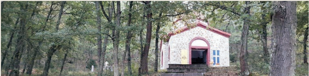
Από το Αναγνωστικό της ΣΤ' Δημοτικού, Αθήνα 1949, σελίδες 166-168.