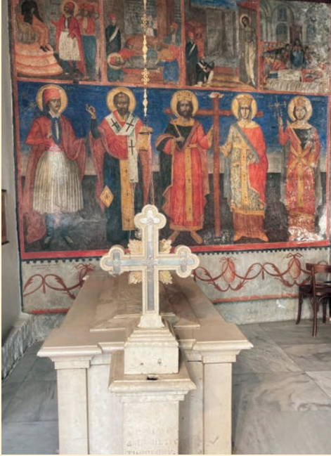
Ο τάφος του Αγίου στο παρεκκλήσιο του Μητροπολιτικού Ναού του αγίου Αθανασίου.

στιανού γίνεται όλο και πιο ζωντανή και πιο βαθιά... Βλέπεις τότε και αισθάνεσαι καθαρά ότι για μεγάλα παραδείγματα εμείς οι Έλληνες δεν είναι ανάγκη να καταφεύγουμε στους καιρούς του Διοκλητιανού ή των πρώτων σαρακηνών επιδρομών, και ότι η χθεσινή ημέρα της Ανατολικής μας Εκκλησίας είναι το ίδιο μεγάλη, όσο και η βαθιά αρχαιότητα.