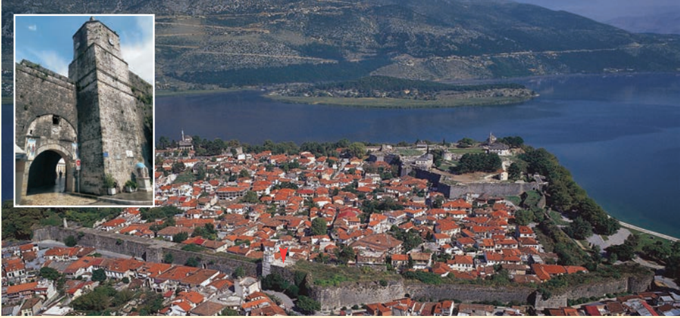
Άποψη του Κάστρου των Ιωαννίνων με το νησάκι στο βάθος. Επισημαίνεται η είσοδος του Κάστρου, το σημείο όπου μαρτύρησε ο άγιος Γεώργιος.