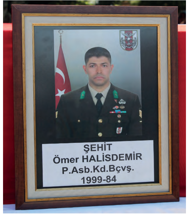
Görsel 4. 14. Vatan, bu topraklar için cihat eden ve bu uğurda canını verenlere minnettardır. (15 Temmuz darbe girişiminde vatan hainlerine karşı savaşırken şehid olan Ömer Halisdemir)

arasında sayılmaktadır. Peygamber Efendimiz de (s.a.v.) şu hadisinde cihatı amellerin en üstünleri arasında zikretmektedir: “Ebû Zer (r.a.) anlatıyor: “Hz. Peygamber’e (s.a.v.) ‘Hangi amel daha faziletlidir?’ diye sordum. ‘Allah’a inanmak ve O’nun yolunda cihat etmek.’ buyurdu.” 31 Hz. Peygamber (s.a.v.) cihata o kadar önem vermiştir ki cihattan kaçınmayı mümin olmakla bağdaştırmamış ve “Allah yolunda savaşmadan yahut da bunu (en azından) gönlünden geçirmeden ölen kimse bir çeşit münafıklık üzere ölü.” 32 buyurarak müminleri cihata teşvik etmiştir. Bir diğer hadisinde ise Peygamber Efendimiz (s.a.v.) cihatla ilgili olarak şöyle buyurmuştur: “Ey insanlar! Düşmanla karşılaşmayı temenni etmeyin, Allah’tan âfiyet (esenlik ve barış) dileyin. Fakat düşmanla karşılaşınca da sabredin ve bilin ki cennet kılıçların gölgesi altındadır.” 33