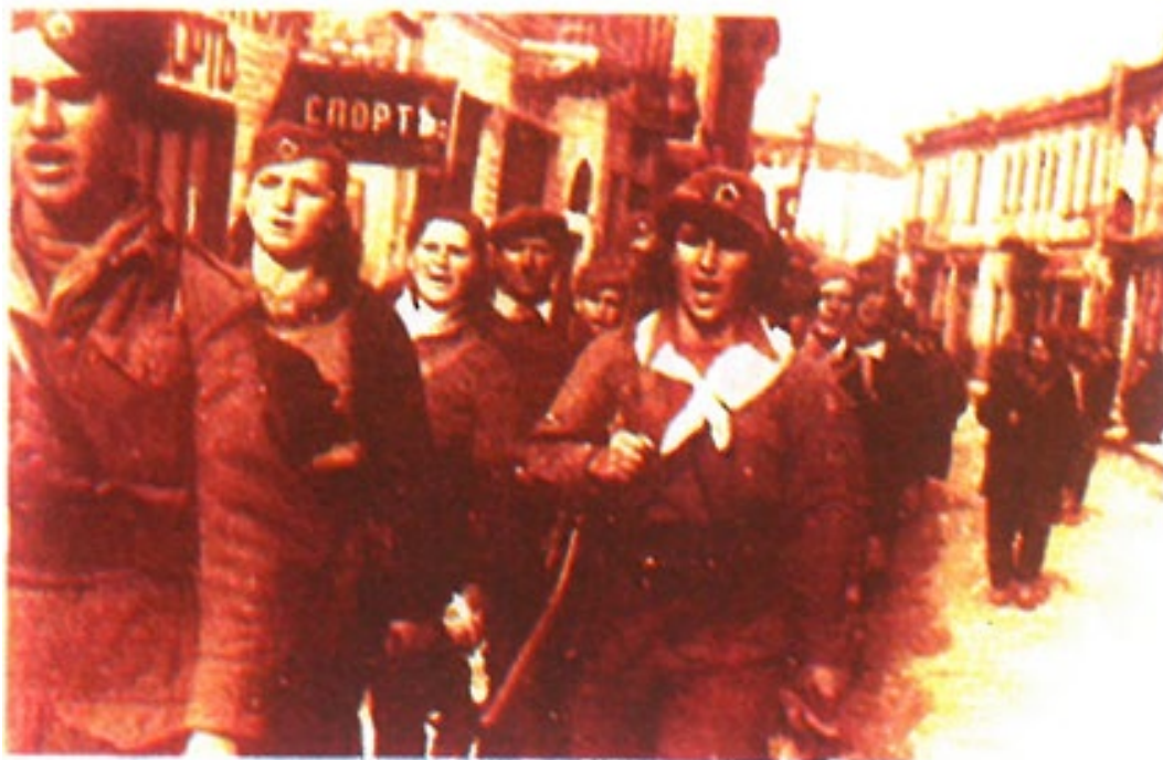
Μακεδоници од Еџејска Македонија во својаџа земја учесџувале во ослободувањето на Биџола

Βελκόσκι-Σεϊντι-Αλιαντέμι-Ριστέσκα-Παβλόβσκι, Ιστορία της 9ης Δημοτικού , έκδ. 4η, 2017, σ. 112