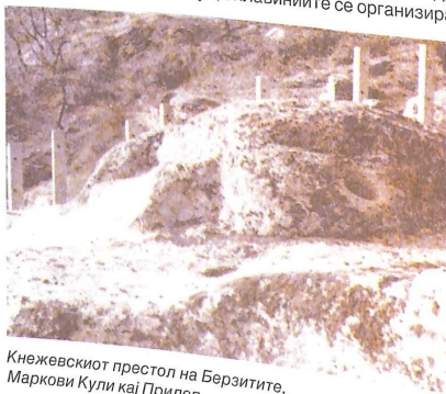
Кнежевскиот престој на Берзитите, Маркови Кули кај Прилеп

По населувањето во Македонија словенските племиња основале свои области кои се нарекувале склавинии. На чело на склавиниите стоеле племенски племето – кнезови. Името на склавинијата се добивало според името на Драговитија, на Велегезитите – Велегезитија и др. Во случај на опасност или кога го опсадувале Солун, склавиниите се организирале во племенски сојуз. Тогаш